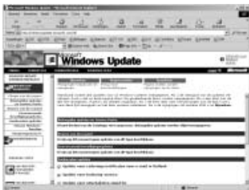
AFBEELDING 2.7 Weergave aanpassen.