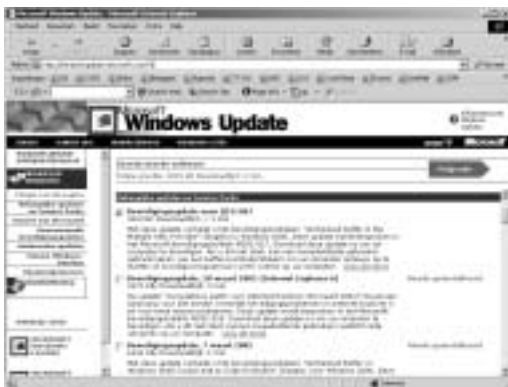
AFBEELDING 2.5 Overzicht van geïnstalleerde updates.

In de browser verschijnt een overzicht van de geïnstalleerde updates, inclusief de datum van uitgifte en de installatiedatum. Tevens worden de precieze versienummers getoond.