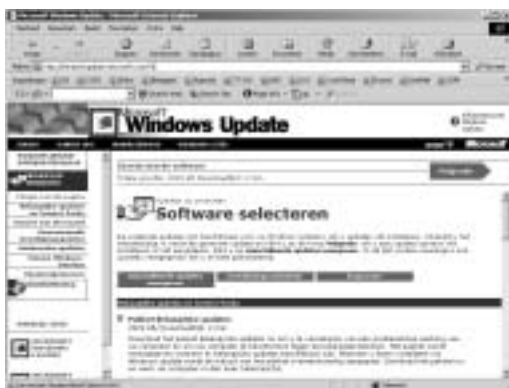
AFBEELDING 2.2 De website Windows Update.