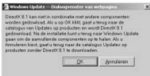
AFBEELDING 2.1 U kunt niet altijd twee updates tegelijk installeren.

Voordat u Windows Update gebruikt, doet u er verstandig aan Internet Explorer 6 te installeren. Versie 6 is ten tijde van het schrijven van dit boek (voorjaar 2002) de meest recente versie. Ook dit gaat via dezelfde website.