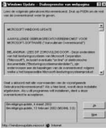
AFBEELDING 2.3 Bevestig in het venster dat verschijnt dat u akkoord gaat met de voorwaarden.